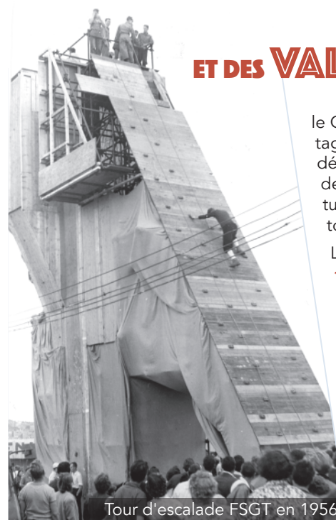
Tour d'escalade FSGT en 1956

le Groupe Alpin Populaire, première section montagne FSGT, voit le jour en 1937. Les activités se développeront principalement après la libération de 1945. Depuis, nous militons pour des sites naturels et urbains de qualités accessibles à toutes et tous.